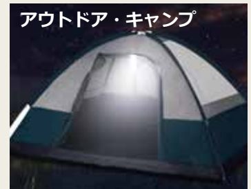
アウトドア・キャンプ